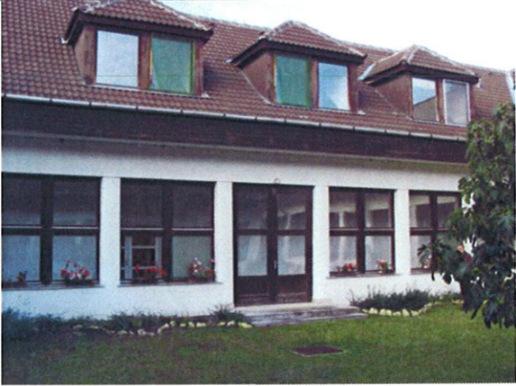
Belső udvari homlokzat