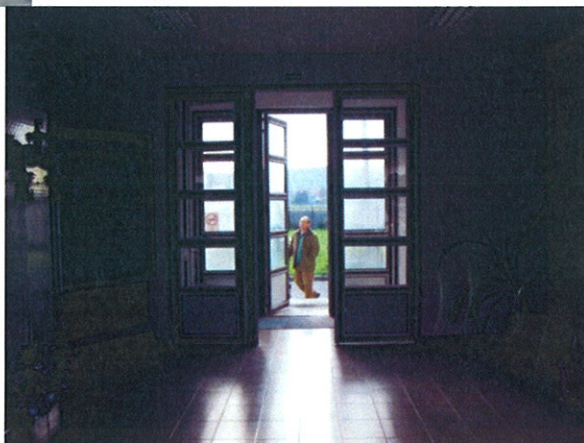
Pótlólagos csukló szerkezet, pótlólagos csuklopánt