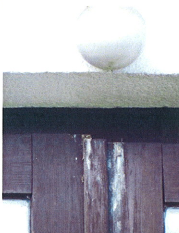
Vetemedett, „lógó” ajtószárny