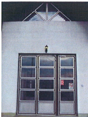
Bejárat ajtó acél/alumínium szerkezete