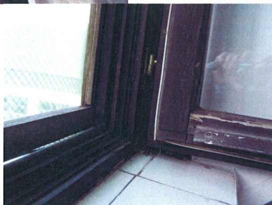
Tokelmozdulás, faszerkezeti repedés